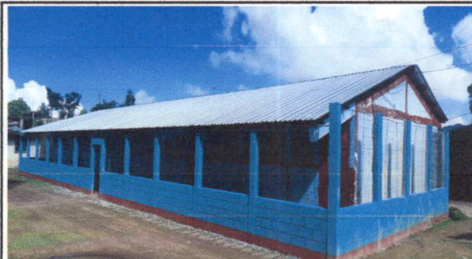
Foto 2: De esta manera es como quedó al frente de nuestra escolita, con cambio de lámina y muro perimetral.