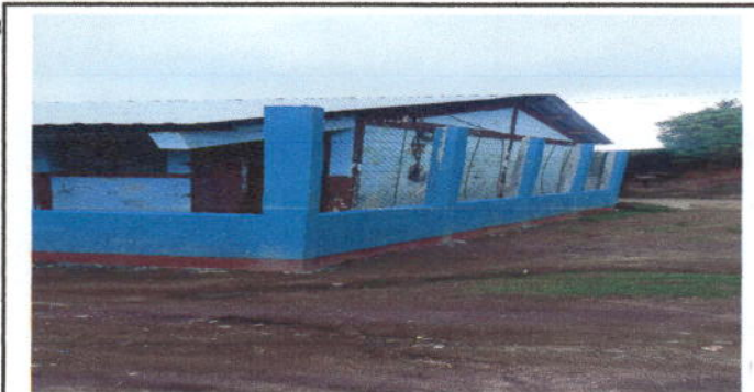
Foto 5: Así quedó terminada la reparación del muro perimetral del lado derecho de nuestro centro educativo.