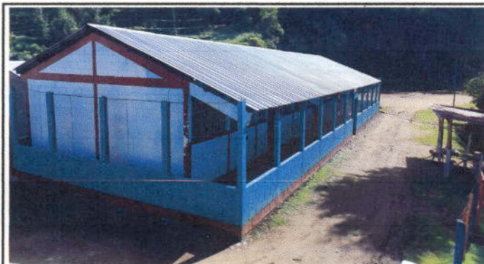
Foto 3: De esta forma se concluyó en el cambio de lámina de los cuatro módulos.