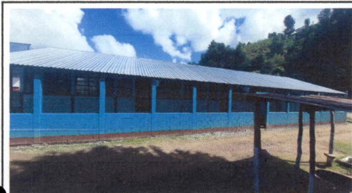
Foto 1: De esta forma es como se finalizó con el cambio de lámina de los cuatro módulos.