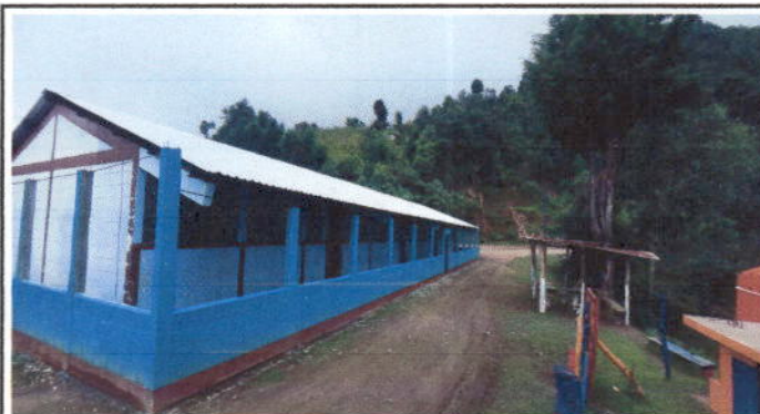
Foto 4: Así quedó terminado el muro perimetral del lado izquierdo y al frente de nuestro centro educativo.