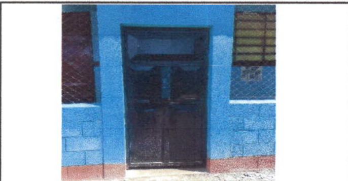
Foto 6: Así quedó instalada la puerta de entrada y salida de nuestro centro educativo.

Observación: Si es necesario se pueden agregar hojas adicionales y actualizar el número de hojas.